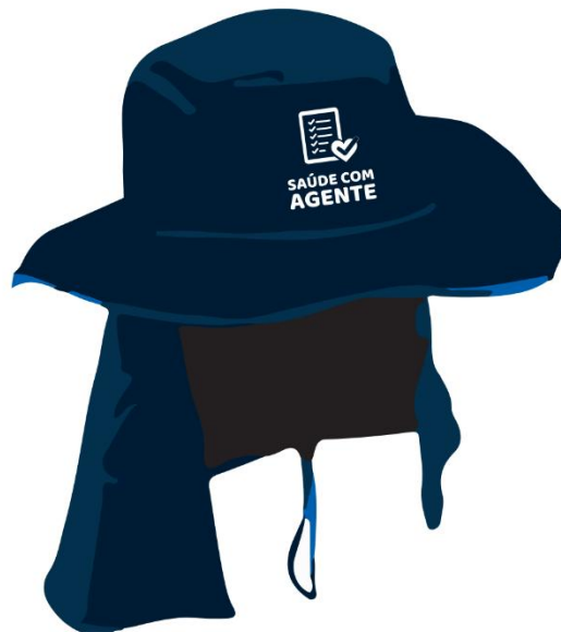
Parte da frente