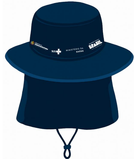
Parte de trás